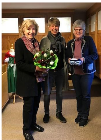
Siebzehnrübel aus Schliersee