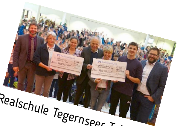
Realschule Tegernseer Tal