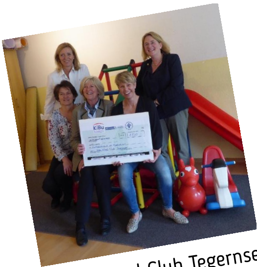
Inner Wheel Club Tegernsee